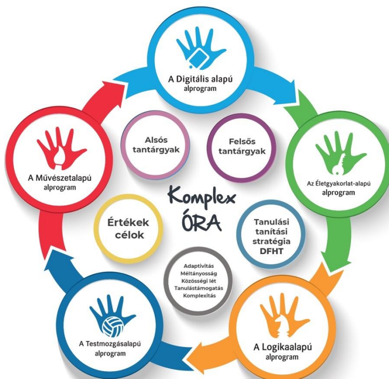
A Komplex órák felépítése